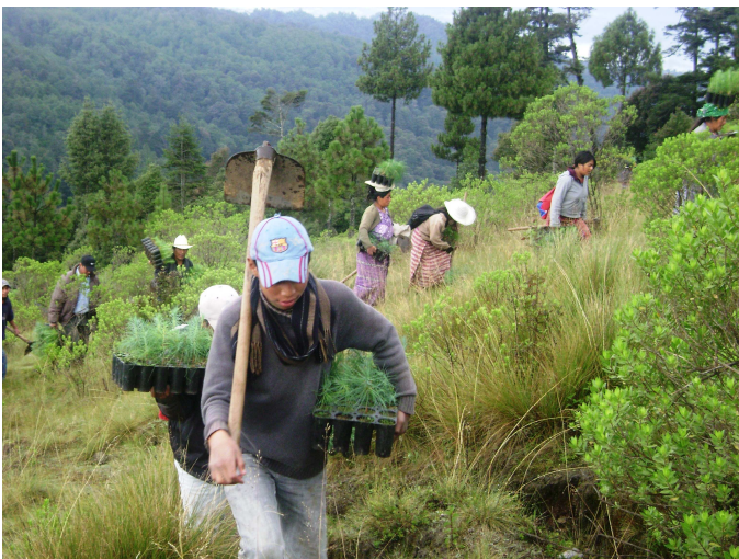
Participación Comunitaria en Reforestación de Bosque, San Vicente Buenabaj.

La metodología del proyecto fue participativa y se basó en el “aprender haciendo”. Para el desarrollo de las acciones cada contraparte elaboró su planificación anual correspondiente, además se estableció un proceso de coordinación interinstitucional entre Helvetas, las contrapartes, y organizaciones gubernamentales como el Instituto Nacional de Bosques -INAB-, Ministerio de Ambiente y Recursos Naturales -MARN-, Ministerio de Educación -MINEDUC-, y Consejo Nacional de Áreas Protegidas -CONAP-.