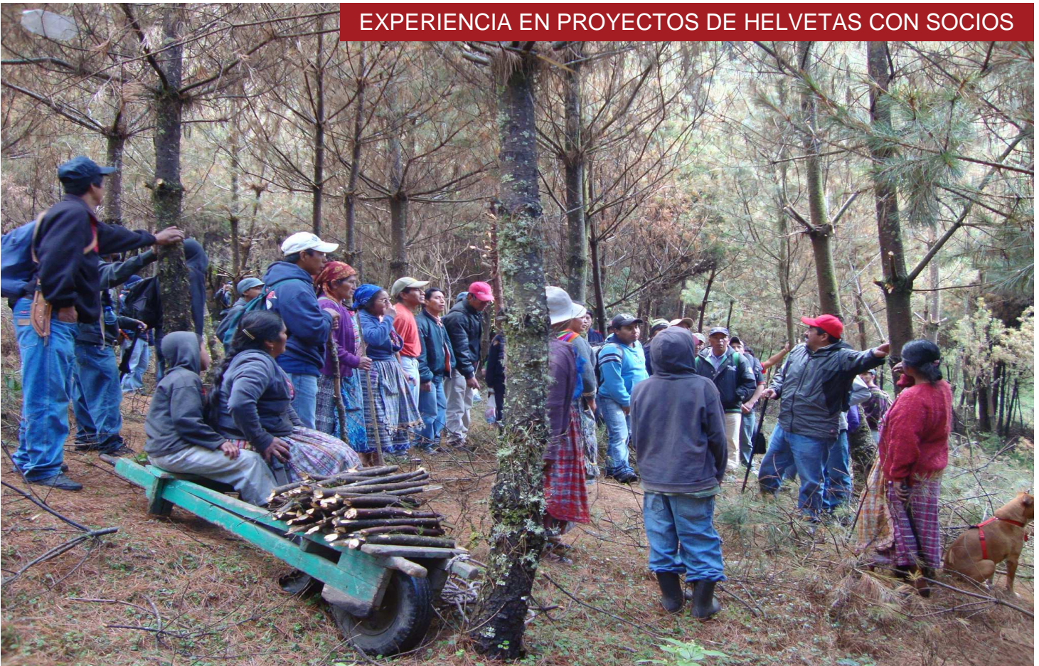
Lider comunitario explicando el manejo del bosque comunal a los líderes de los 48 Cantones de Totonicapán.