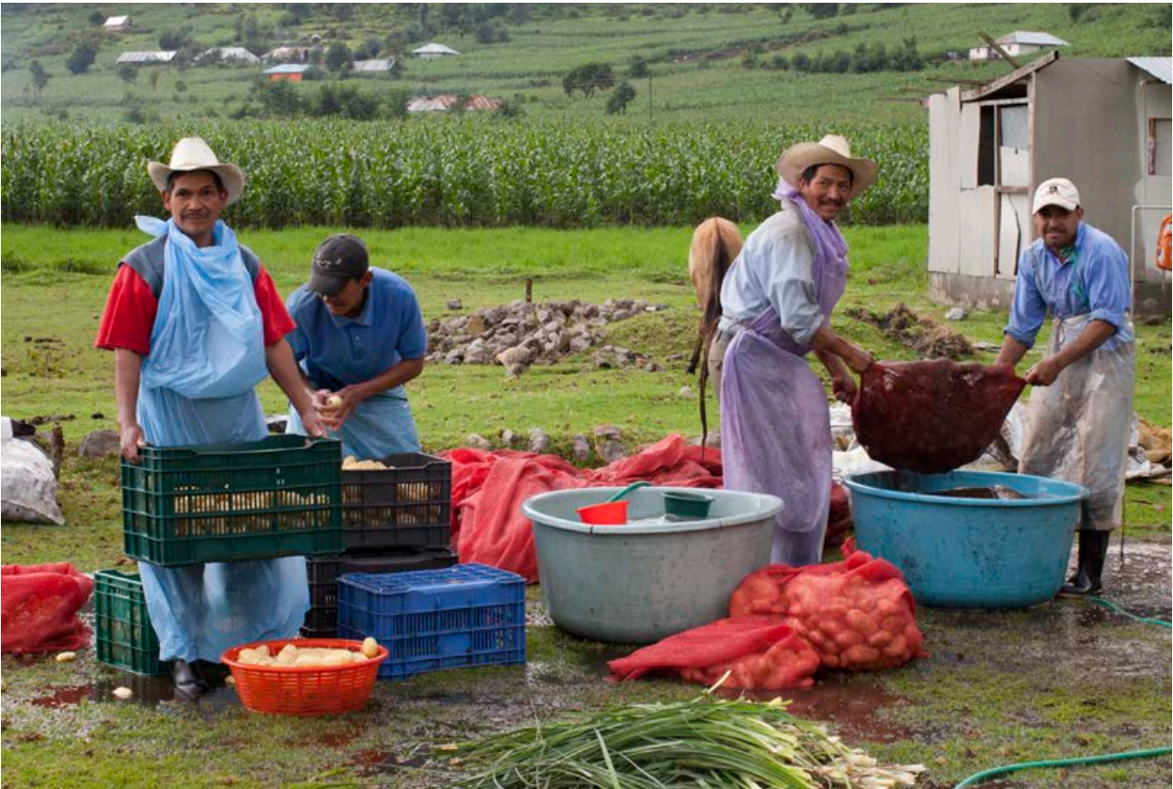
Comunidad El Plan, Agricultores lavan sus patatas, Ixchiguan, Guatemala