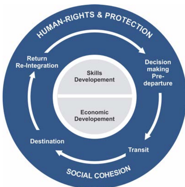
El ciclo migratorio y las líneas de acción (Helvetas, 2020)