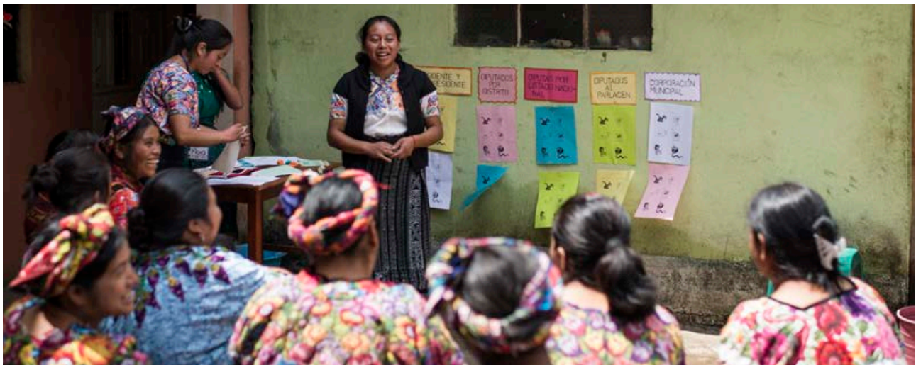
Instructor que imparte formación sobre procesos electorales y democráticos, Chiquirichapa, Guatemala

Cuando los migrantes y sus familias están mejor informados, empoderados y protegidos, se reconoce ahora ampliamente que la migración laboral es más beneficiosa para los migrantes, pero también para los países de origen y de destino. La nueva administración estadounidense ya ha anunciado cambios estratégicos al respecto (e.g. “The Biden Plan to Build Security and Prosperity in Partnership with the People of Central America”) y los expertos piden que se aumenten los canales de migración legal mejorando el acceso a los programas de visado H-2A y H-2B y negociando acuerdos laborales bilaterales mutuamente beneficiosos 31 . Esto podría beneficiar adecuadamente a los sectores que necesitan más mano de obra y reducir la migración irregular y sus riesgos conexos.